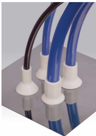
GROMMET PTG 1/4"-1/2" (6mm to 12 mm)